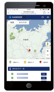
浸水アラートマップ