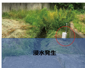
センサが浸水を検知